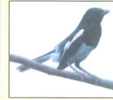
Magpie (ম্যাগপাই) দোয়েল