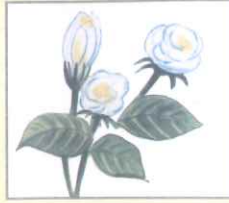
Bela (বেলা) বেলী ফুল