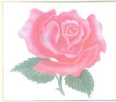
Rose (রোজ) গোলাপ