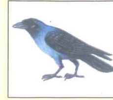
Crow (ক্রো) কাক