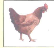
Hen (হেন) মুরগী