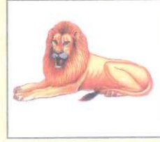
Lion (লায়ন) সিংহ