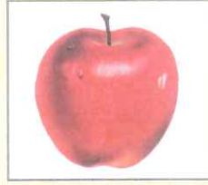
Apple (অ্যাপল) আপেল