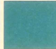
Green (গ্রীন) সবুজ