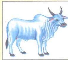
Cow (কাউ) গরু