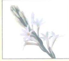
Tube-rose (টিউব-রোজ) রজনীগন্ধা