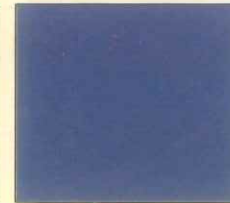
Blue (ব্লু) নীল