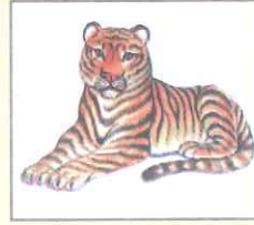
Tiger (টাইগার) বাঘ