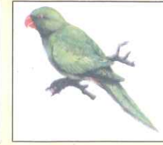
Parrot (প্যারট) টিয়া