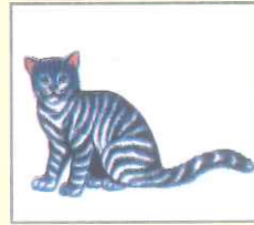
Cat (ক্যাট) বিড়াল