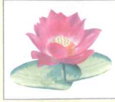
Lotus (লোটাস) পদ্ম