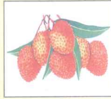
Lichi (লিচি) লিচু