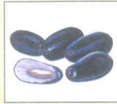
Berry (বেরি) জাম