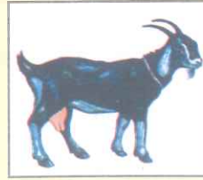
Goat (গোট) ছাগল