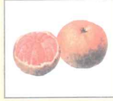
Orange (অরেঞ্জ) কমলালেবু