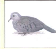
Dove (ডাভ) ঘুঘু