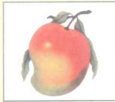
Mango (ম্যাংগো) আম